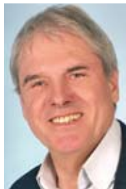
Siegmund Braune Wahllokale: Grundschule Bruckhausen Gaststätte Heidekrug